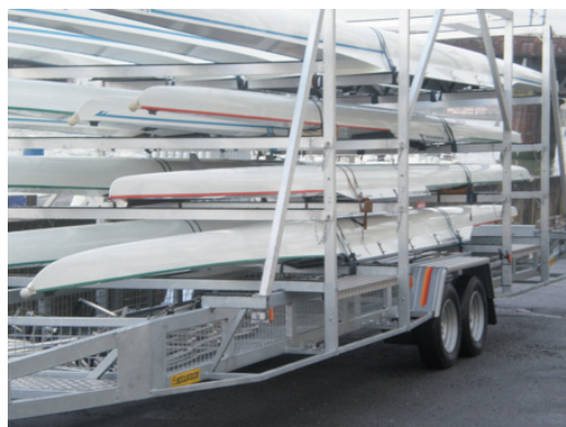
Matériel prêt pour Sainte-Livrade

en senior, Thibault Ospital (1er) en junior, Clémence Casbas (2nde) senior filles ont porté haut et fort les couleurs rouges et vertes. Un beau résultat d'ensemble pour une descente faite avec un bon courant et une température clémente.